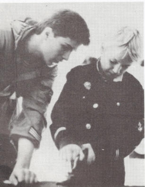
24. Мужское занятие.