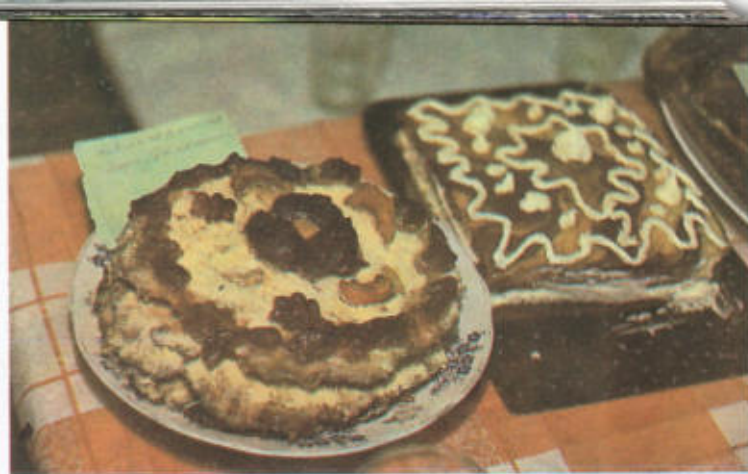
31. Своими руками.