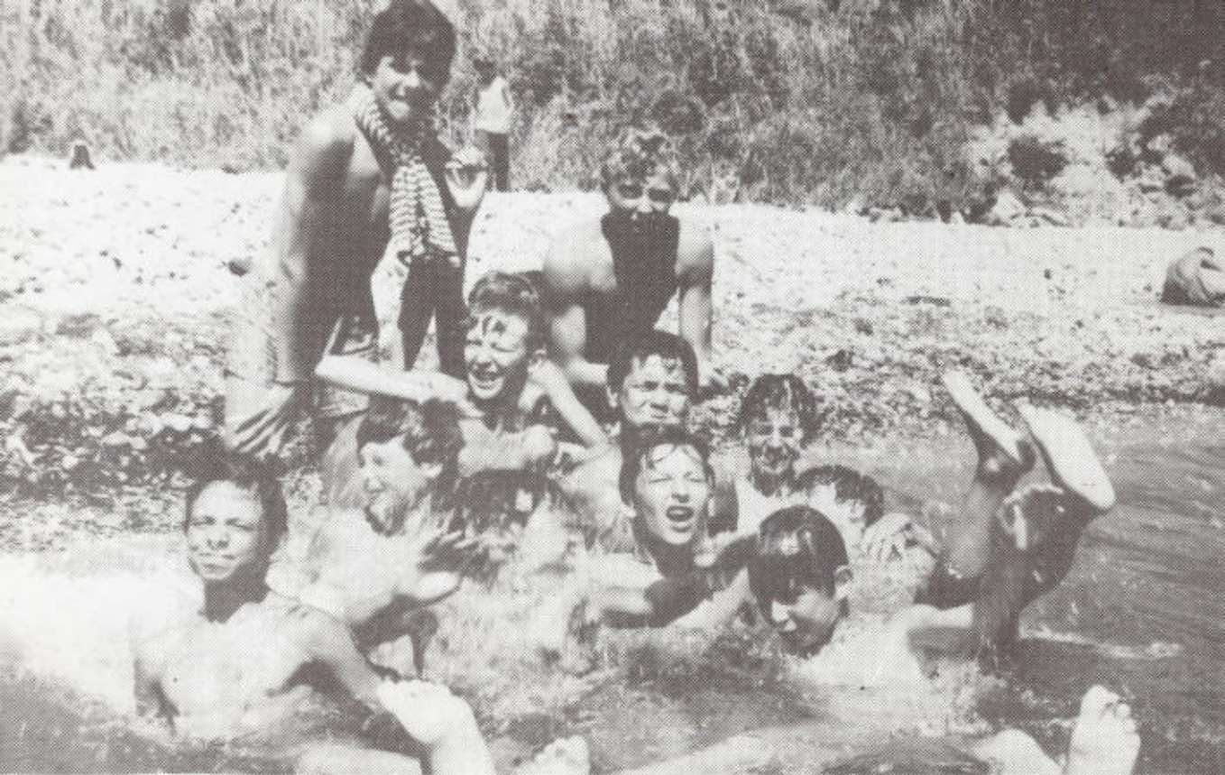
12. Курсантский лягушатник.