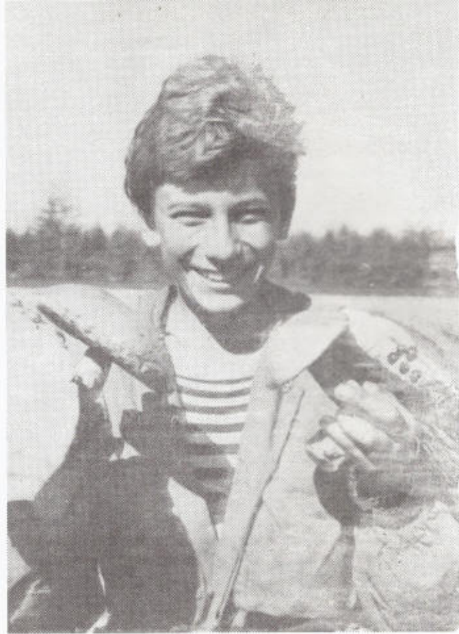
9. Щедрые дары магаданских лесов.