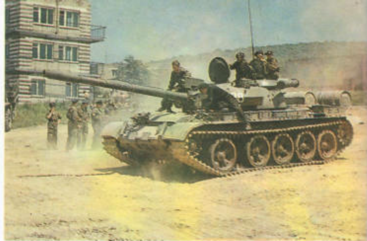
27. Путь к мастерству.