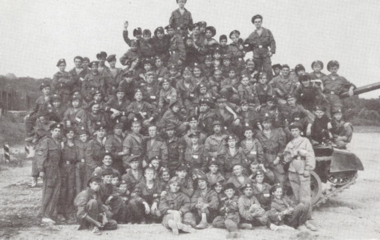
3. Вместе — дружная семья!