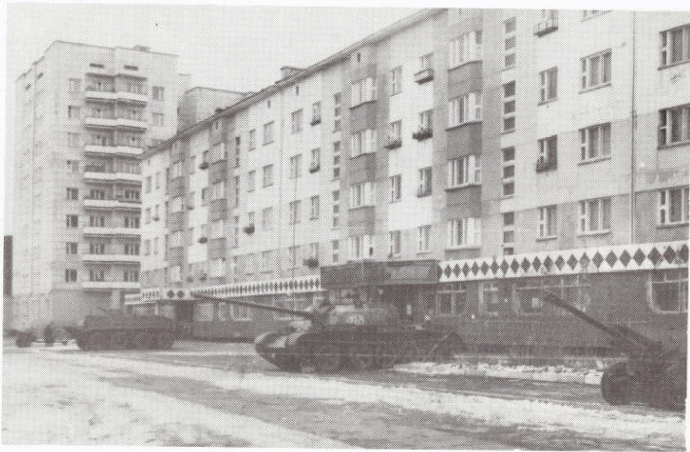
10. Для детворы «Подвиг» — второй дом.