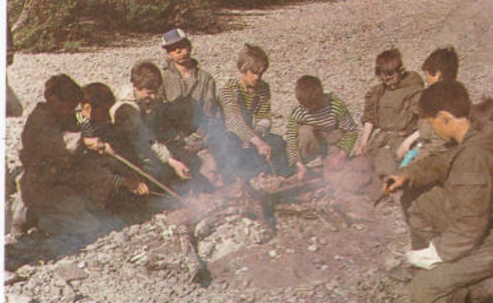
28. Главное лакомство ребят — печеная картошка.