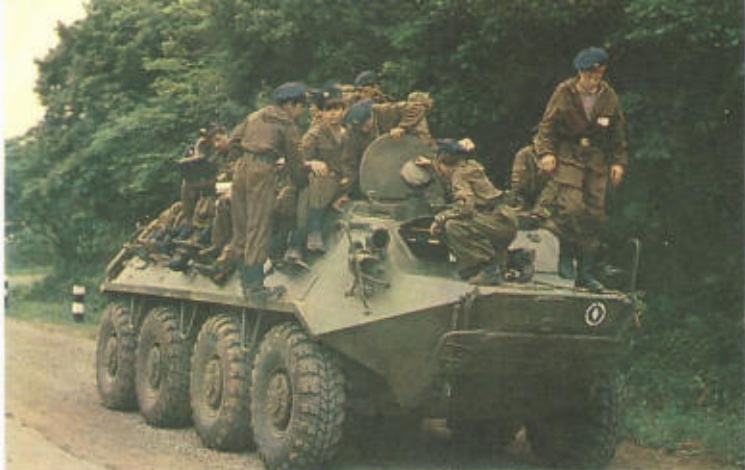
30. Верхом на бронетранспортере.