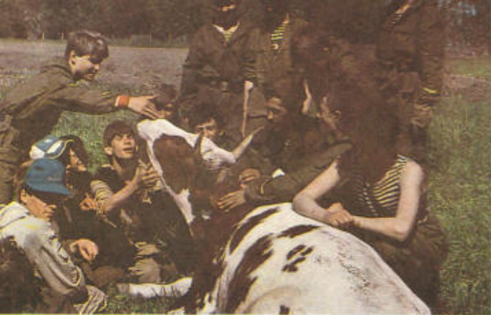
17. Как жизнь, буренка?