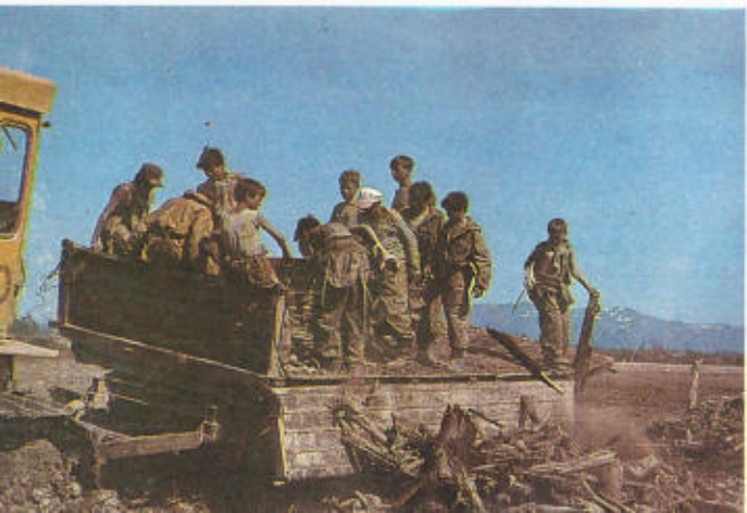
21. Помогаем деревне.