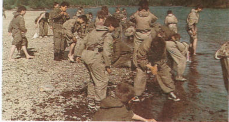
4. Мужские игры на свежем воздухе.