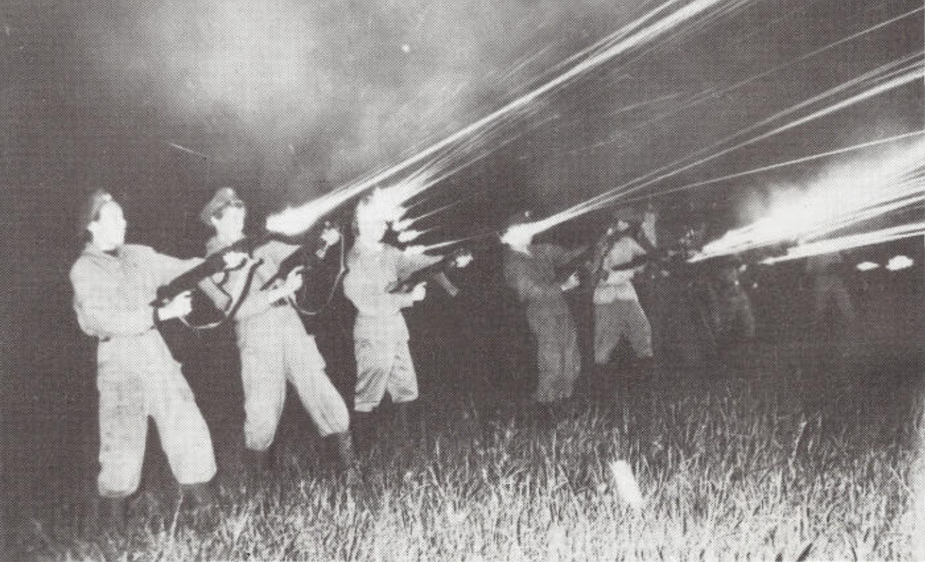
8. «Световое искусство» в исполнении авторского курсантского коллектива.