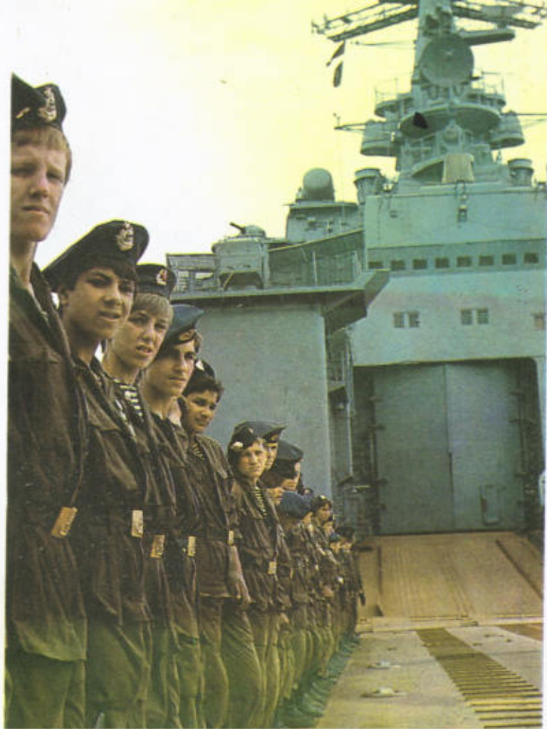
19. На экскурсию — к военным морякам.