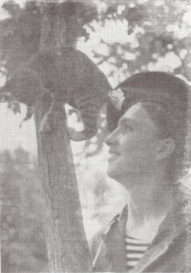
7. Укрощение уссурийского «тигра».