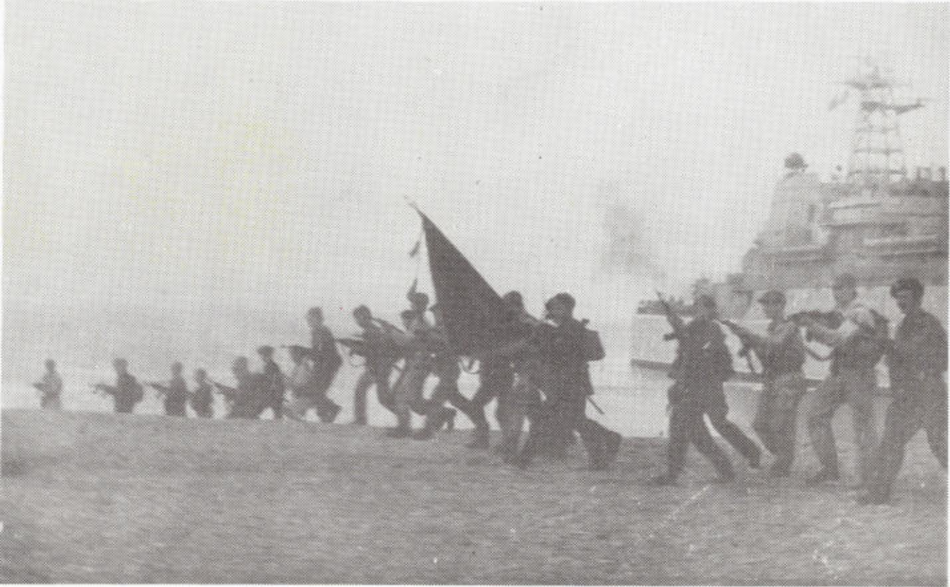
13. Летние сборы в воинском подразделении Приморья.