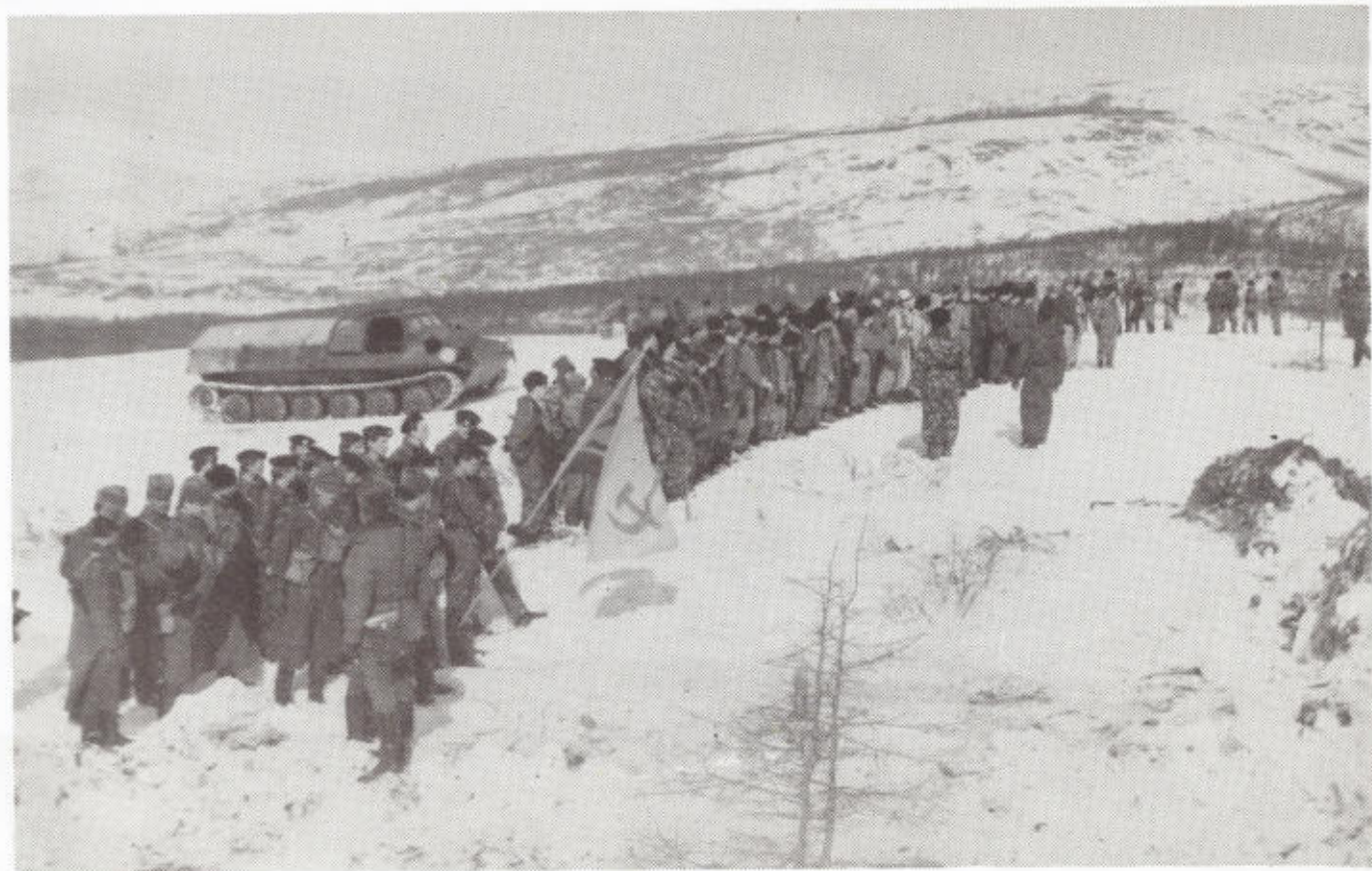
11. Перед «боем» на военно-тактических учениях «Атака-89».